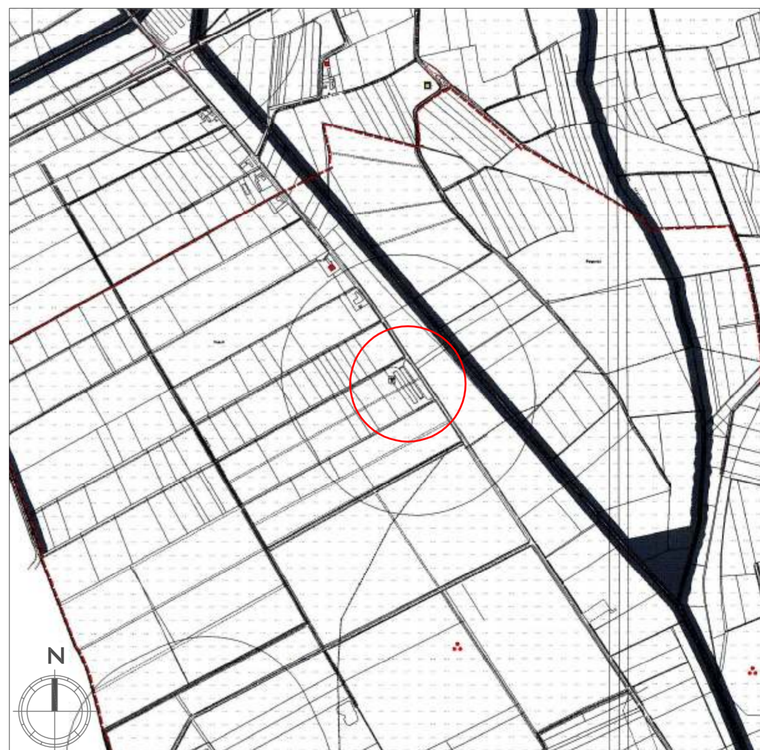
ESTRATTO DI P.R.G.C. scala 1:10.000